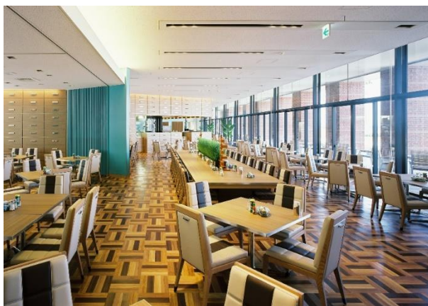
懇親会会場「レストラン ジョリポー」